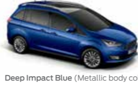
Deep Impact Blue (Metallic body colour)