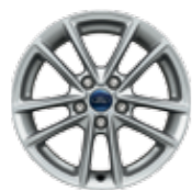
جنط مقاس 16 بوصة . 10 ريشة 16" Alloy wheels 10 spokes