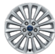
جنط مقاس 17 بوصة . 10 ريشة 16" Alloy wheels 10 spokes