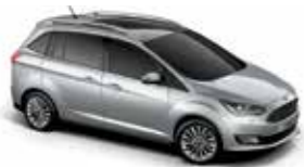
Moondust Silver (Metallic body colour)