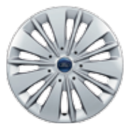
جنط مقاس 16 بوصة 16 inch steel wheels with covers