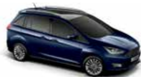
Blazer Blue (Solid body colour)