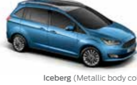
Iceberg (Metallic body colour)