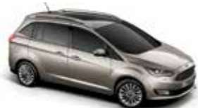
Tectonic Silver (Metallic body colour)