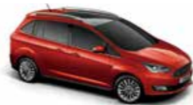
Red Rush (Special metallic body colour)