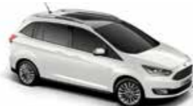
Frozen White (Special metallic body colour)