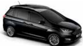
Absolute Black (Metallic body colour)