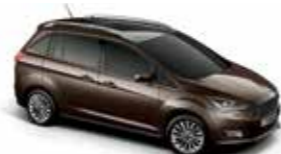
Caribou (Metallic body colour)