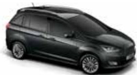
Magnetic (Metallic body colour)